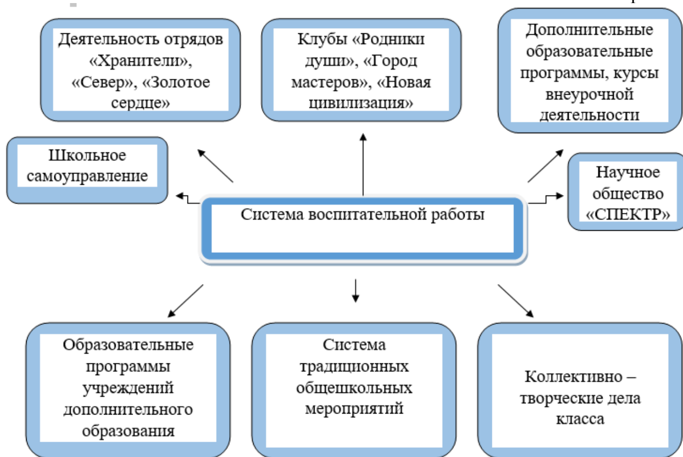
Схема. Система воспитательной работы

В школе действует научное общество учащихся «СПЕКТР», основная задача которого - формирование у обучающихся компетентностей поисково-исследовательской работы.