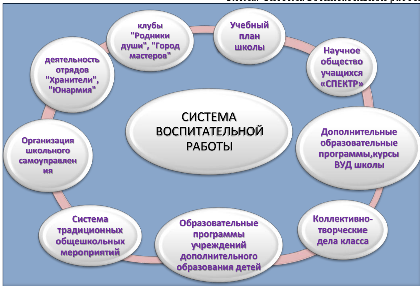
Схема. Система воспитательной работы

В школе действует научное общество учащихся «СПЕКТР», основная задача которого - формирование у обучающихся компетентностей поисково-исследовательской работы.